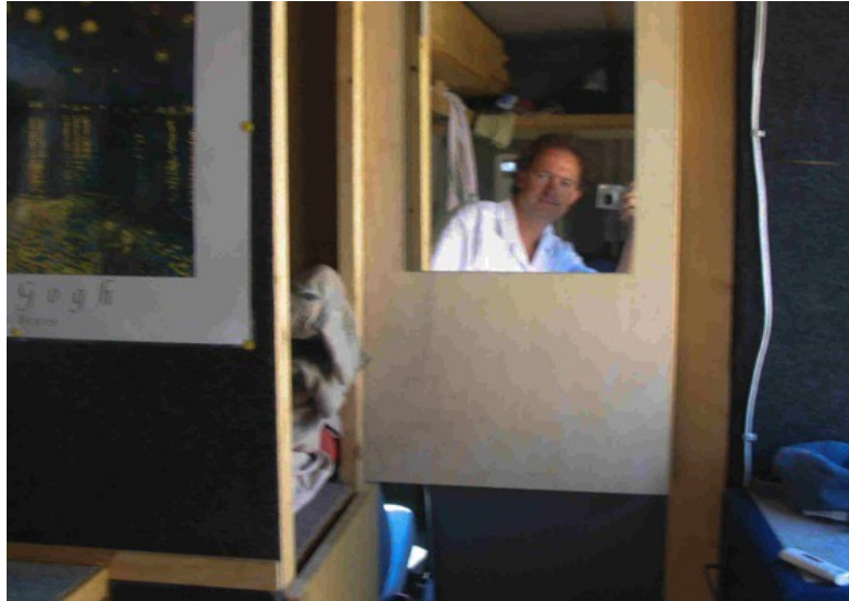
„Vergangenheit Selbstbildnis im VW Bus 2005“

Erläutern Sie die beste Aufgabenstellung, die Ihnen im Kontext Kunstvermittlung begegnet ist?